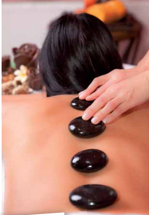
Medical Spa Unital