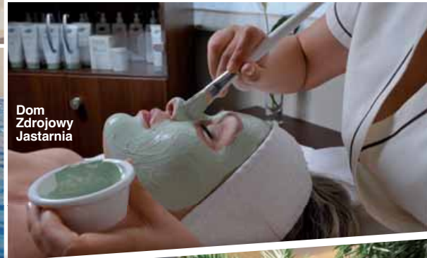
Dom Zdrojowy Jastarnia