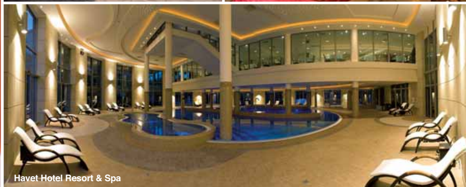
Havet Hotel Resort &amp; Spa

i jak najdokładniejsze odwzorowanie panującej tam, uzdrowskiej atmosfery. W tym celu zaplanowano otwarcie basenu solankowego o piętnastoprocentowym zasoleniu, łaźni solankowej, łaźni błotnej i słonecznej łączki, kompleksu saun, całorocznego jacuzzi zewnętrznego, kriokomory oraz 16 kolejnych gabinetów pielęgnacji ciała.