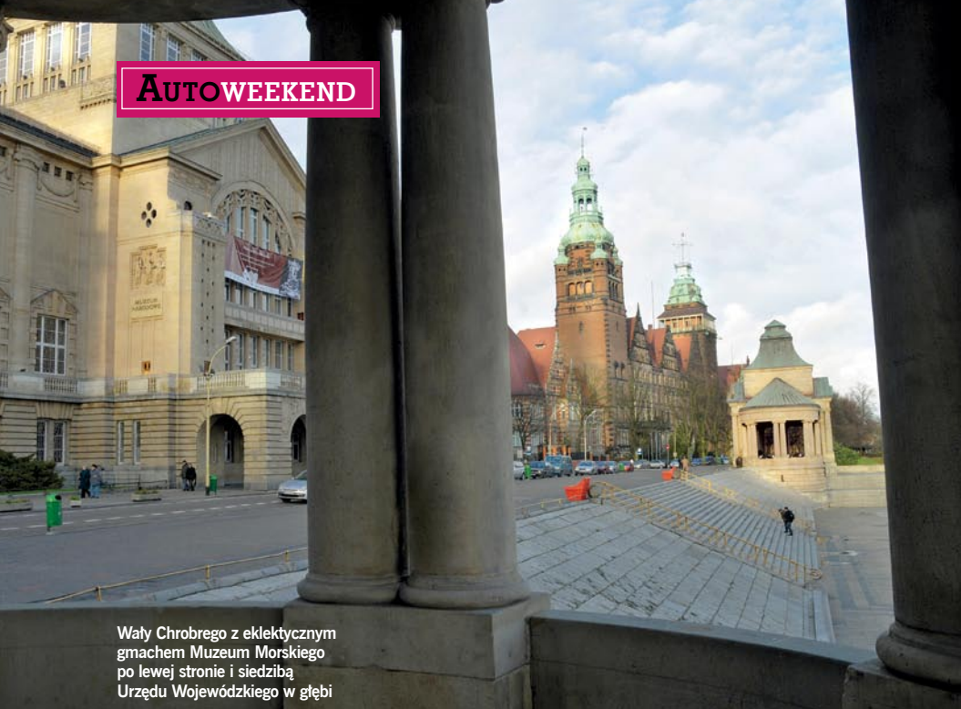
Wały Chrobrego z eklektycznym gmachem Muzeum Morskiego po lewej stronie i siedzibą Urzędu Wojewódzkiego w głębi

pobytowe, łączące zabiegi w Spa z noclegami. Jeden z takich pakietów to tzw. „Marokańskie Księżniczki”. To oczyszczający skórę rytuał Rassoul, polegający na naniesieniu na ciało leczniczego błota, które pod wpływem ciepła rąk masażysty usuwa złuszczone komórki naskórka. W dawnych czasach stosowały go marokańskie księżniczki na dzień przed wyjściem za mąż – stąd jego nazwa. Goście hotelowi mogą także korzystać z klubu Baila Club i z kawiarni znajdujących się w tym samym budynku. Szczególnie warta polecenia jest wizyta w Café 22. Znajduje się ona na 22. piętrze, dzięki czemu można stąd podziwiać panoramę miasta i okolic. A ponieważ mieści się ona w samym centrum Szczecina, z każdej strony jest co oglądać. Położenie hotelu Radisson SAS jest także wielkim atutem w przypadku organizowania konferencji czy spotkań biznesowych. Sale konferencyjne w hotelu zostały w tym roku odnowione – dzisiaj może tu jednocześnie uczestniczyć