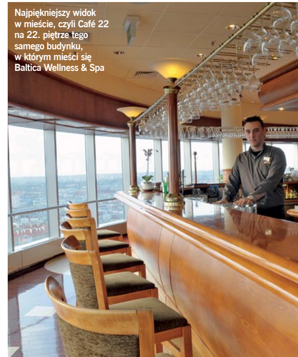
Najpiękniejszy widok w mieście, czyli Café 22 na 22. piętrze tego samego budynku, w którym mieści się Baltica Wellness & Spa

Jedną z zalet Baltica Wellness & Spa jest bezpośrednie połączenie z hotelem Radisson SAS. Goście hotelowi mogą bez konieczności wychodzenia na dwór, w szlafrokach jeśli chcą, przejść bezpośrednio na teren spa. Dostępne są także pakiety